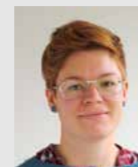
Ida Sylwan Institutet för jordbruks- och miljöteknik, Förtillverkade avloppsanläggningar