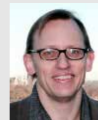
Erik Kärrman Urban Water Management, Beslutsstöd i VA-planering