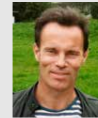
Thomas Larm StormTac AB, Åtgärdsplaner, recipientpåverkan